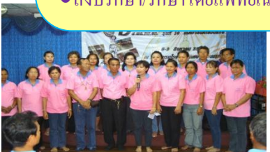
๗. แผนงานด้านเด็กและสตรี ศูนย์การศึกษาระดับประถมศึกษา